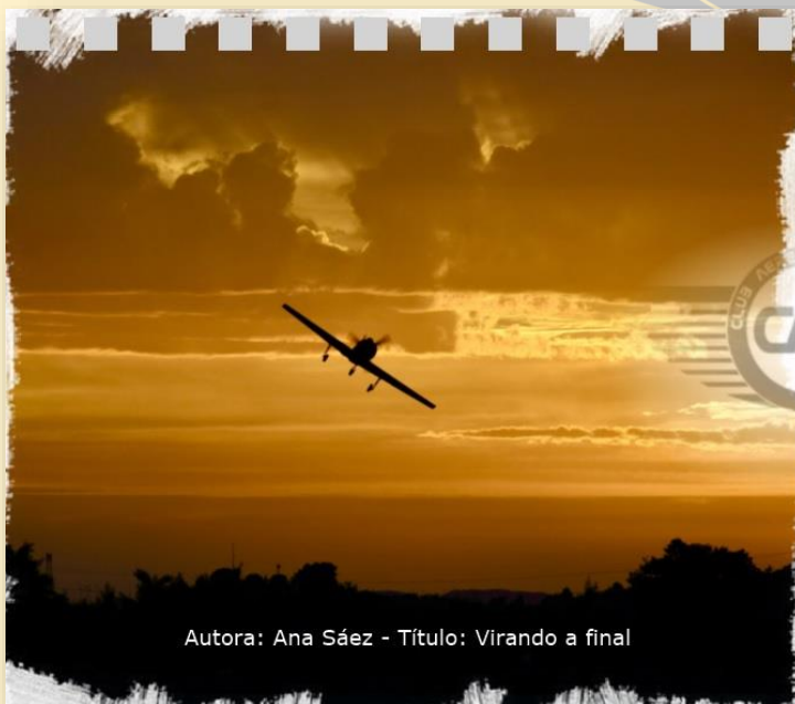
Autora: Ana Sáez - Título: Virando a final